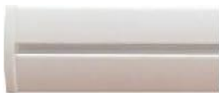
Бял (RAL 9003)