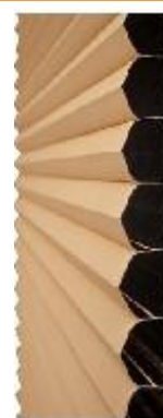
Дует фикс (Duette Fixe)

Дует (Duette) - платът наподобява пчелна пита.